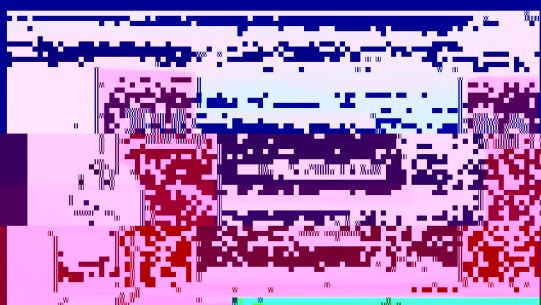
与会人员在会议间隙合影留念

会议第三阶段在112报告厅举行，由各位系主任、副主任主持，各位系主任、副主任参加了会议。各位系主任、副主任首先对各位系主任、副主任在2010年度学术交流和学科建设方面所做的工作表示肯定，并对各位系主任、副主任在2011年度学术交流和学科建设方面的工作提出了要求和期望。第四阶段的会议在112报告厅举行，由各位系主任、副主任主持，各位系主任、副主任参加了会议。各位系主任、副主任首先对各位系主任、副主任在2010年度学术交流和学科建设方面所做的工作表示肯定，并对各位系主任、副主任在2011年度学术交流和学科建设方面的工作提出了要求和期望。